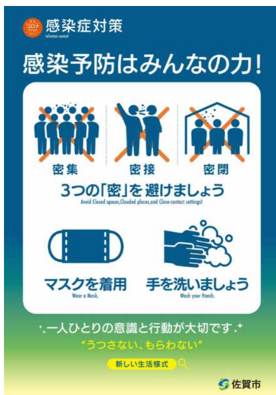
感染拡大防止啓発ポスター