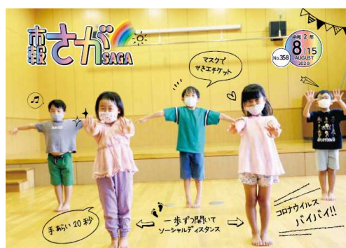
市報 8/15 号