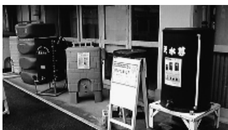
墨田区の雨水貯留タンクの展示

佐賀市においては高木瀬地区など田地が急速に減ってきた地区では内水の一時貯留機能が失われてきました。墨田区が取り組んでいる雨水貯留施設等の設置促進の効果は一定程度認められるので、高木瀬地区や駅周辺の浸水対策にも役立つと考えられます。また、市民の方々の方々の浸水対策や雨水利用に対する意識の向上にもつながると思います。