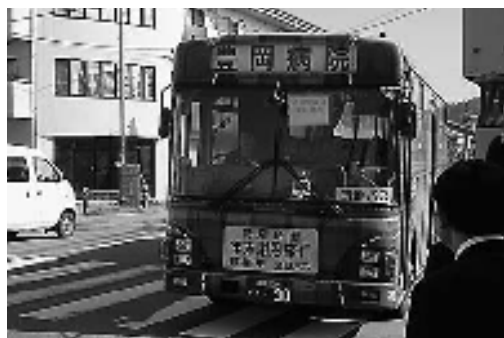
豊岡市の民間路線バス

特に、公共交通空白地域のコミュニティバス等の運行については、本市においても地域主体の運行協議会等を