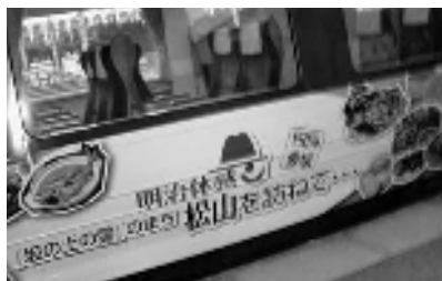
JRと連携の「観光PRラッピングトレイン」

松山市では実在した文化人を徹底して観光資源に生かすという意気込みが感じられ、トップダウンで進められた「二十一世紀まちづくり構想」で、計画的整備が図られてきました。佐賀市でも計画的整備の必要性を感じ