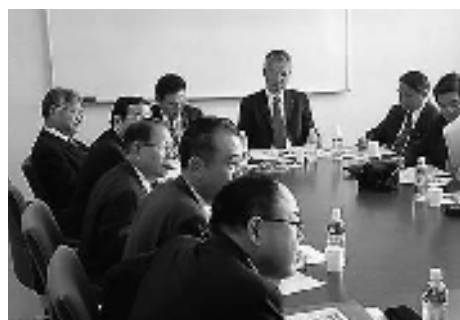
豊岡市での視察のようす