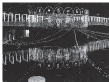
鳥栖市のハートライトフェスタ

ライトファンタジーの今後のあり方を検討するため、検討委員会を設置した。この中の主な意見として、市民参加型への移行、商店街の垣根を越えた多様なイベントの展開、歩いてもらえるようにすることが重要だとの意見があった。主な目的は中心市街地の活性化で、中央大通りの場所は欠かせない。内容については、検討会での