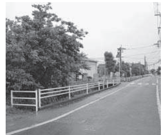
安全対策が必要な校門前道路

答弁 ①警察、道路管理者、市民活動推進課、学校、地元などを含めた体制②実施期限が本年8月末となっている③道路管理者や警察に改善の要望を出していく。子どもたちへの安全指導の徹底、PTAや地域と連携した見守りを拡充していく必要がある④学校や教育委員会から道路管理者に連絡をするようにしたい⑤子ど