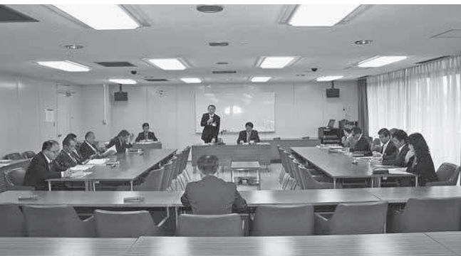
第1回議会運営等改革検討会のようす