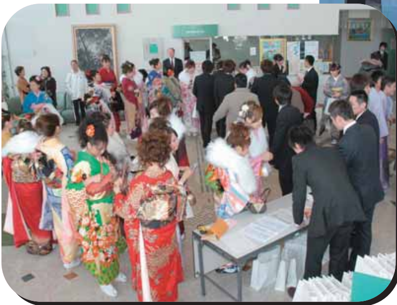
諸富文化体育館「ハートフル」 での成人式