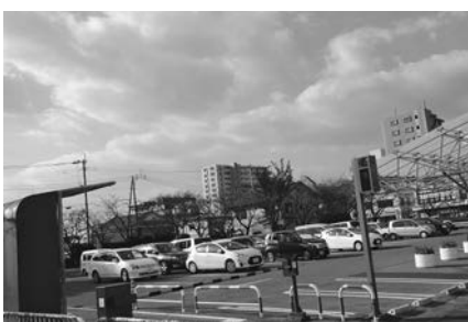
佐賀市役所駐車場