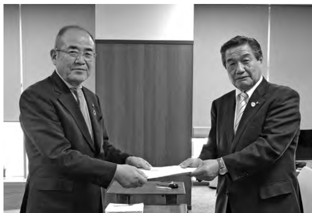
左：秀島市長、右：川原田議長

対処方針等の内容については、議会ホームページの「市議会からのお知らせ」（2月14日掲載）をご覧ください。