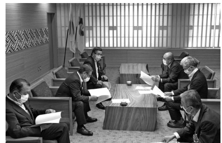
提出時に附帯決議の内容を伝える