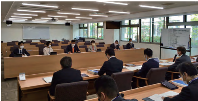
事務事業概要研修会の様子

10月に行われた市議会議員選挙後、初めてとなる定例会を間近に控え、今回当選した新任議員に向けた研修会が行われました。 新任議員フォロー研修では、定例会の流れや市政一般について質問をする一般質問の流れなど、基礎的な研修を行いました。また、別日に開催した市各部署の事務事業概要についての研修では、一つ一つ真剣に執行部からの説明に耳を傾け、活発な質疑応答が繰り広げられました。