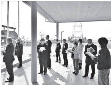
こども園の参考とした神埼市の施設を現地視察

廊下とウッドデッキを一体とした遊びの場として活用できるよう300平方メートルのウッドデッキを設けている。さらに、障がい児の受け入れ等で医務室の配置やバリアフリーの問題もあるため、ある程度、余裕があるスペースを設けたことで、2,000平方メートルとなった。