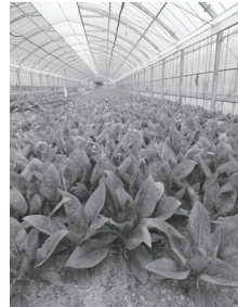
トレーニングファーム研修用ハウス内のハウレンソウ