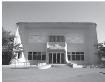
大隈重信記念館（佐賀市水ヶ江）