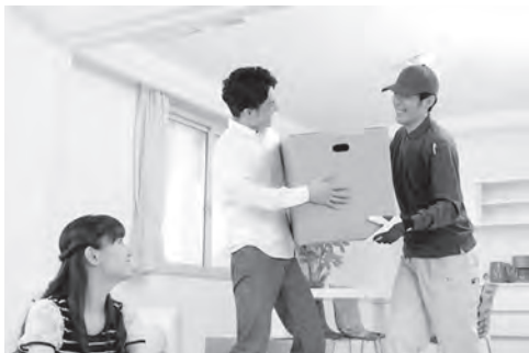
佐賀市へようこそ