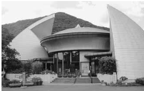
徐福長寿館（金立町）

答弁 佐賀市消費者センターでは、消費生活相談員を平成十七年十月からは四名配置しており、各支所の相談体制としては、相談日に業務委託先から一名を配