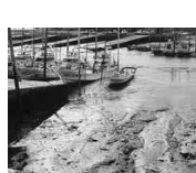
漁港に堆積する泥土

期以外にもこのような攪拌作業によって浮泥の堆積を抑制できないかについても検証していきたい。