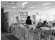
佐賀市消費者センター（アイスクエアビル4階）

消費生活に関する苦情や相談は年々増加し、内容も複雑化しているが、現在の相談員体制と対応はどうか。また、ADR（裁判外紛争解決手段）機能の充実や、市民への相談窓口のPR方法にも工夫が必要ではないか。