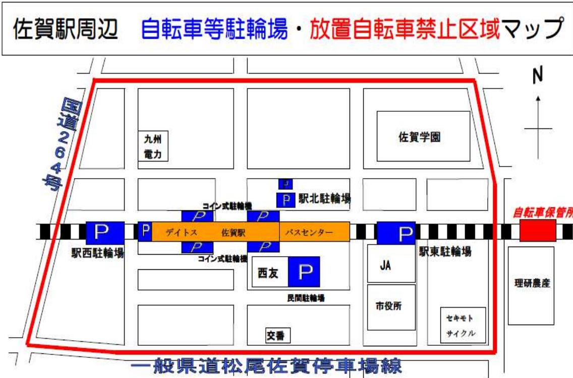
放置自転車の撤去及び返還の状況