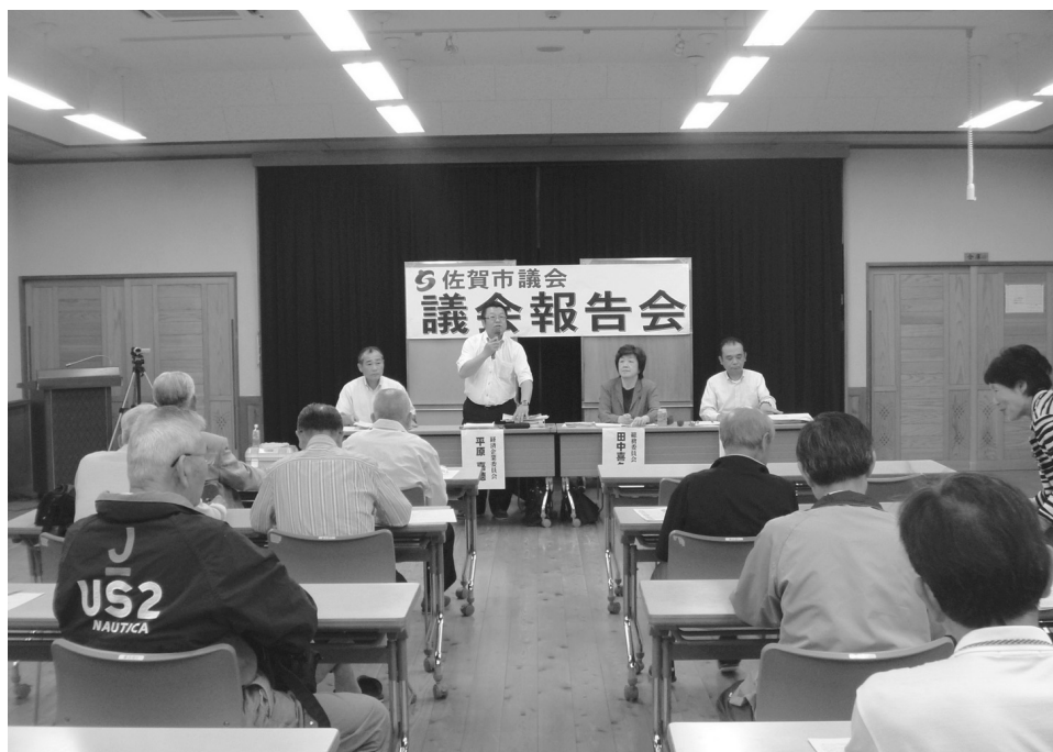
<議会報告会のようす>