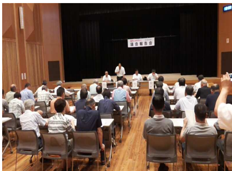
<議会報告会のようす>