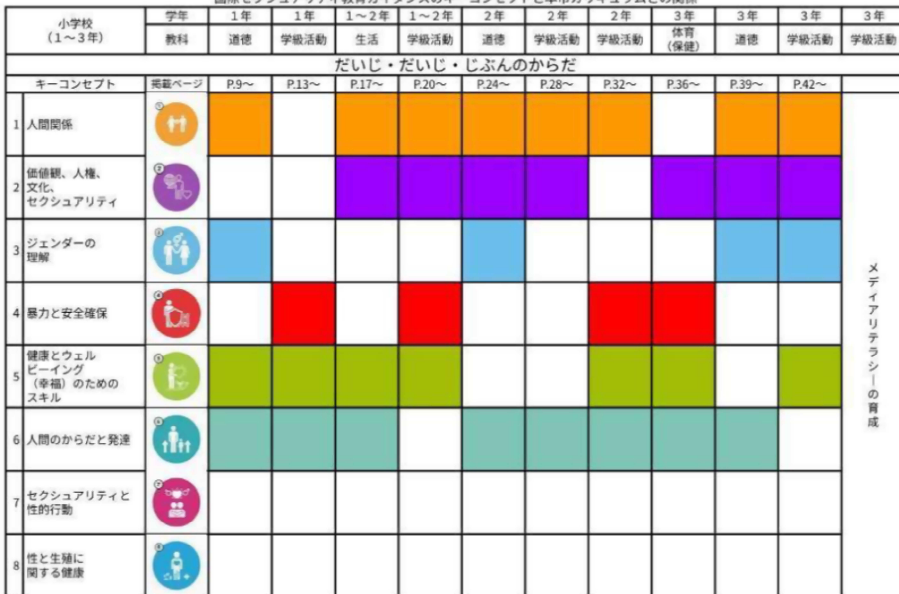
国際セクシュアリティ教育ガイダンスのキーコンセプトと本市カリキュラムとの関係