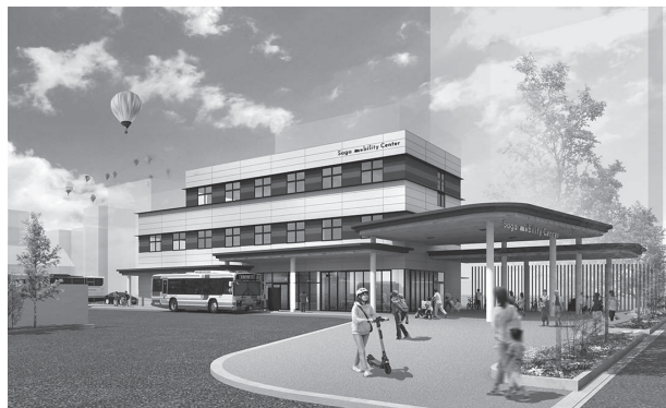
SAGAMOBILITYセンター（仮称）イメージ図