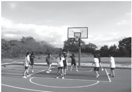
バスケットボールコート整備イメージ