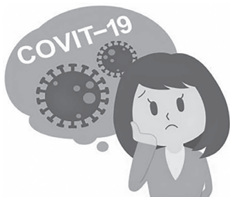
コロナワクチン接種後の健康被害が心配だなぁ

問 日本のワクチン追加接種は世界と比べても高い水準にあり、健康被害だと気付いていない人も多い。行政が窓口だと知らない人も多い①佐賀市はどことが窓口になるのか②今後健康被害が増えることが予想されるが、市は独自に接種後の検証を行う考えはあるか。 答 ①ワクチン接種後の健康被害の相談は健康づくり課で対応。健康被害の相談や申請には保健師による丁寧な相談対応を行っている②健康被害に関する検証には、全国的に統一したデータ収集や客観的で信頼性の高い最新の科学的知見に基づく専門的な審議を行い、評価・検討を行う必要があるが、市独自でワクチンの検証を行うことは困難であると考えられる。今後も引き続き、予防接種による健康被害の不安を感じている市民に対する適切な相談対応やその後のサポート等に取り組むたい。