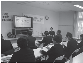
ツノスポーツコミッション(宮崎県都農町)を視察

答 ①1年後にはスタートできるような、令和8年度は組織の形態や具体的な事業内容、収支計画等を整理し、準備を進めていきたい②まちづくりや経済、観光、教育など多岐にわたる分野の課題をスポーツを生かして解決できないかという視点で捉え、設立準備段階からそれらを共有していくことがこの取り組みを成功させる鍵になるのではないかと考えている。今後、全庁的に十分連携を図りながら立ち上げに力を尽くしていきたい。