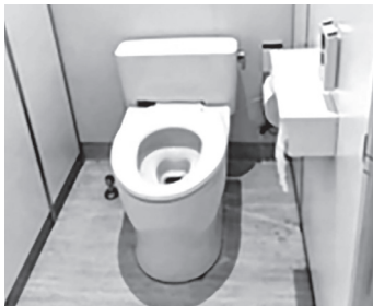
改修され明るく清潔感のある トイレ

問 ①学校トイレの改修ならび に洋式化は急務である。未改修 の学校について、改修する学校 を1校でも増やして、計画を前 倒しすることはできないのか② 改修したトイレの環境を長く維 持するために、定期的な清掃を 外部に委託することはできない か。 答 ①トイレの洋式化は、国 の予算を活用し前倒しして取 り組んでいる。トイレ環境は、 児童・生徒の健康、衛生面に 直結する基礎的な教育環境で あるため、優先度の高い課題 として位置づけ、スピード感 をもって整備を進めていきた いと考えている②日常の清掃 活動は、児童・生徒による清 掃を基本としているが、限ら れた時間の中で十分に行き届 かない箇所が生じる場合もあ る。このため、衛生面の確保 を図るため、希望する学校に は、便器清掃業務の外部委託 を実施している。