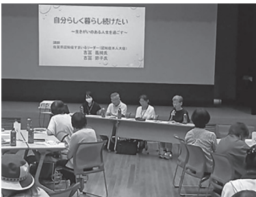
認知症の本人大使は、自らの言葉で希望を発信します

問 認知症は誰もがなり得る。①早期発見・早期治療の取り組み内容は②認知症当事者の声を聴き、暮らしやすいまちづくりにつなげていく「本人参画」の取り組み内容は③認知症の方に対する効果的なケア技法であるユマニチュードを本市でも普及啓発できないか。 答 ①おたっしや本舗において認知症の方や家族への支援体制を強化した。また、早期の相談や受診につながるよう「佐賀市版認知症ケアパス」を刷新し、市報に認知症特集を掲載した②市内15カ所のおたっしや本舗で、本人ミーティングや座談会などを通して認知症の方や家族の思い、意見を伺っている③認知症サポーター養成講座の中でユマニチュード技法と類似したコミュニケーション技法を紹介している。市民向け講座へのユマニチュードの導入については、調査、研究したい。