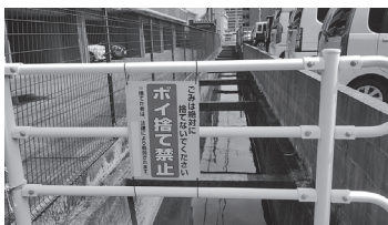
「ポイ捨て禁止！」市が設置する看板の例

問 ①市ではごみのポイ捨てに對しどのような指導をしているか②警察に通報・指導した数は③必要な箇所にはごみのポイ捨てを禁止する看板を設置しては④学校での清掃ボランティアの実態は⑤さらに広報や啓発活動に力を入れるべきでは。 答 ①パトロール班が土日を除く毎日、巡視を実施。悪質な不法投棄には警告看板や監視カメラの設置などで対応。排出者への直接指導や警察への通報も実施②通報件数は令和5年度6件、6年度6件、7年度7件。嚴重注意は各年度1件、2件、2件③注意喚起看板の作成など、状況に応じて対応している④小学校ではPTAや地域と連携し、中学校では生徒会を中心に実施。市はボランティア袋の利用案内やごみ回収等で支援⑤効果的な広報や啓発について今後も検討していきたい。