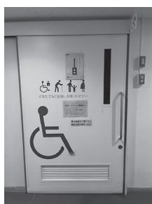
指定避難所における多目的トイレ

答 ①指定避難所81カ所のうち、多目的トイレを備えている施設は78カ所、スロープを備えている施設は80カ所。未設置箇所については、今後の改修工事の機会に整備を進めたい②指定避難所については、市のホームページ等に掲載しているが、多目的トイレ、スロープ等の設備の有無については掲載していない。これらの情報を表示することにより避難所選択の一助になると考えており、今年の出水期までに市のホームページ等に情報を掲載し、安心して避難できる環境を整えたい。