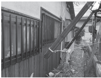
鉄骨の先が削り取られて刃物の先のようにとがっている

問 倒壊したら鉄骨の先が隣家に突き刺さる恐れや2階の鉄骨が隣家の屋根に落下する恐れがあるなど、危険な状態の空き家があり、近隣住民が大変困っている場合の対応は。また、所有者等に対して、指導しても改善されない場合、市での代執行は可能か。 答 個別の事案に応じた対応となるが、基本的には、自主的な改善を促すため、助言、指導等を文書等でを行い、対応されない場合は、直接訪問し、面談等を行う。その後、勧告を行っても改善されない場合は、法定の手続きを経て、危険を解消するよう命令し、履行されない場合、危険性、必要性、相当性を考慮しつつ、市が必要な措置を代執行することとなる。なお、空き家が著しく危険な状態で重大な損害を及ぼす恐れがあると認めるときは、市で緊急的な措置の実施を検討する。