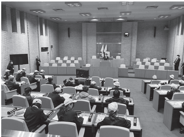
金立小学校6年生の皆さん