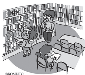
図書館で読書する子どもたち

問 市は子どもたちが読書に親 しむ環境づくりのため「佐賀市子 どもの読書活動推進計画」を定め ている。①市が学校図書館に求め る役割は②蔵書の質を担保するた め廃棄と購入を適切に行う必要 があるが現状は③今後の学校図書 館への支援の方針は。 答 ①子どもたちの主体的 な学びを支える学習情報セン ターとしての役割と、創造力 を培い豊かな心を育む読書セ ンターとしての役割を求めて いる②蔵書は管理システムに より利用状況等を把握しなが ら、図書館司書が基準に基づ き廃棄や購入を行い、魅力的 な蔵書となるよう工夫してい る③学校間および市立図書館 と相互貸借や、図書資料の計 画的な整備により、豊かな読 書経験の充実に努めている。 子どもの主体的な学習活動を 支援するために、学校図書館 の活用を推進したい。