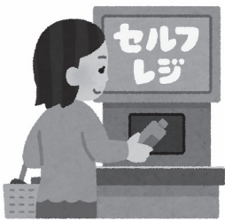
便利になったタッチパネルも障がい者にとっては一苦勞

問 ①読書バリアフリー法および読書バリアフリー計画についての本市の見解は②障がい者へのデジタルデバイス解消に向けた対策は③佐賀市障がい者プランの読書バリアフリー法への対応やデジタルデバイス対応の項目を充実させるべきではないか。 答 ①読書バリアフリーの推進に係る計画と位置付けて、令和3年に第3次佐賀市立図書館サービス計画を策定した。対面朗読や電子図書館等のサービスを行うっており、次期計画は図書館本館のリニューアル時に策定予定である②障がいの特性に応じたコミュニケーション手段を利用できる環境整備を進めており、デジタルと人による支援の相互補完が重要と考える③現行計画でも対応しているが、次期プランの策定では、状況変化や多様なニーズを踏まえ、内容の充実を図っていききたい。