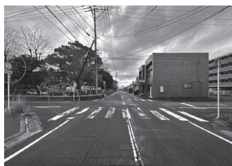
正解は、一時停止？直進？右折？左折？

答 ①当該交差部は、登下校時に自転車利用の生徒が多く通行する一方、生活道路の抜け道として自動車の通行も一定数あることから、自転車と自動車と交錯するなど事故の危険性がある箇所として把握している②一方通行や進入禁止の標識の視認性向上、逆走防止に向けた進入抑制の工夫さらには優先道路の見直しを含めた交通安全対策について、周辺の交通実態を踏まえながら、交通規制を所管する佐賀県警察および道路管理者と協議を進めていく。