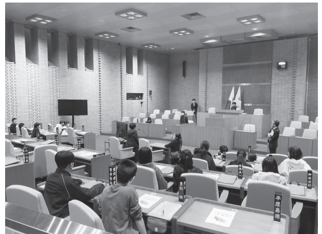
日新小学校6年生の皆さん