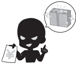
被害が増えている投資詐欺

問 近年、投資詐欺被害が増え ている。投資詐欺を未然に防ぐ ためには、詐欺手口の周知だけ では不十分で、お金の使い方を 適切に判断する力である金融リ テラシーを身に付けることが大 切である。幅広い市民に向けた 金融リテラシー講座を検討でき ないか。 答 18歳から単独で契約が可 能となることを踏まえると、 若年層の段階からの金融リテ ラシー教育の実施が重要であ る。現在、高校生には金融経 済教育推進機構や佐賀県銀行 協会が、佐賀大学の学生には 佐賀財務事務所が講師となり、 金融や経済の基礎知識や投資 の仕組みなどに関する教育が 実施されている。市でも啓発 パンフレットの配布や消費生 活講座を実施している。今後 は関係機関との連携をいっそ う深め、市民が金融について 学ぶ機会の充実に向けた取り 組みを進めていく。