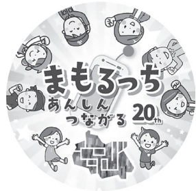
児童見守りシステム (まもるっち)

問 不審者から命を守る対策は 急務①不審者情報数は②取り組 みは③人がいない場所で鳴るだ けの防犯ブザーは命を守れない。 品川区で実績20年の「まもるっ ち」のように通報、状況確認、 駆けつけが一体のGPS・通話 機能付き防犯ブザーの導入を検 討できないか。 答 ①令和4年40件、令和5 年30件、令和6年33件②地域 の方々による登下校時の声か けや誘導等に加え、みまもり びとアプリを通じ地域住民が 動く受信スポットとなり、端 末を持った小学生の位置情報 を把握する見守りサービス 令和5年5月から開始③GPS 機能に加え通話機能を備え た端末は、より高い安心感に つながると認識しているが、 本市が導入している見守り サービスは地域全体で子ども を見守る体制づくりを進める ものであり、今後もアプリ登 録者数をさらに増やしたい。