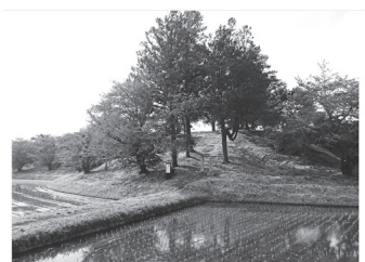
木が茂り古墳の景観を損んでいる銚子塚（金立町）

答 ①まずは、土地を取得された方から十分にお話を伺ってみたい。その上で、文化財の保全や活用といった点に関し、市としてできる部分については、ぜひ協力していきたい②この古墳には、スギやサクラ、クロガネモチといった樹木が多くあり、中には枝が伸び過ぎていたり、枯れかけていたりするものも見受けられる。国の史跡なので、国への手続きが必要となる場合があるが、古墳への影響がないよう留意しながら、適切な管理に努めたい。