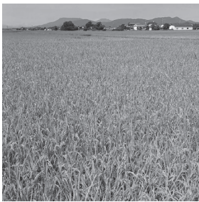
農業振興や人口減少対策などが課題の市街化調整区域

問 ①市街化調整区域の農業振興地域において農業を行うことの利点は②青地に分家住宅を建てるまでの手順と所要期間は③開発の規制緩和の現状は④空き家対策について広く知ってもらうために、相談窓口を本庁以外にも設置の検討ができないか。 答 ①農業振興地域では、土地改良事業や多面的機能支払交付金制度などの対象となり、農業生産基盤の整備や農業生産の安定化を図る投資が行われている②分家住宅の建築には農振除外、農地転用許可、開発許可が必要。農振除外は約9〜10か月、農地転用・開発許可は約1〜2か月を要する③50戸連檐制度や分家住宅制度、既存宅地制度廃止に伴う救済措置制度などにより、特例的に開発を可能としている④各支所での巡回相談会の実施に向け詳細を検討している。